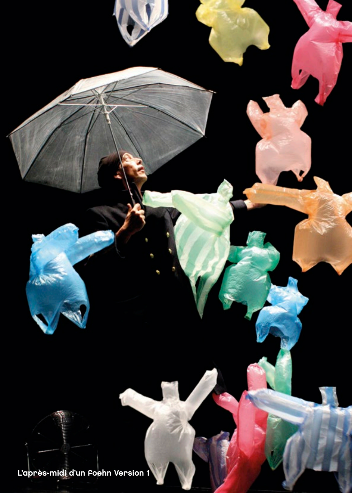
L'après-midi d'un Foehn Version 1